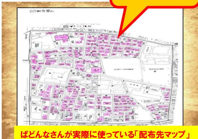
ばどんなさんが実際に使っている「配布先マップ」