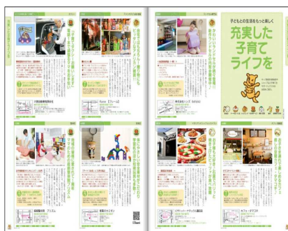
●フォーマット広告