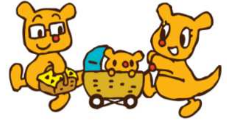
まみたんキャラクター だいでい / りーたん / まみー