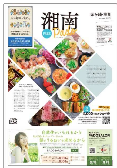
※誌面見本はすべてイメージです

『湘南PADO』では、より湘南地域のお店や人、モノ・コトにフィーチャーし、多様な情報をご紹介します。そこで暮らす人々が、街の魅力を再発見し、楽しみを見つける「きっかけ」となるメディアをお届けします。