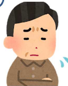
自治体ご担当者様