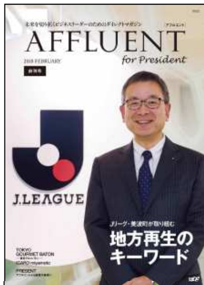
AFFLUENT for President