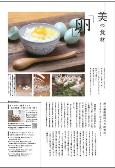
▲ 編集コラムイメージ