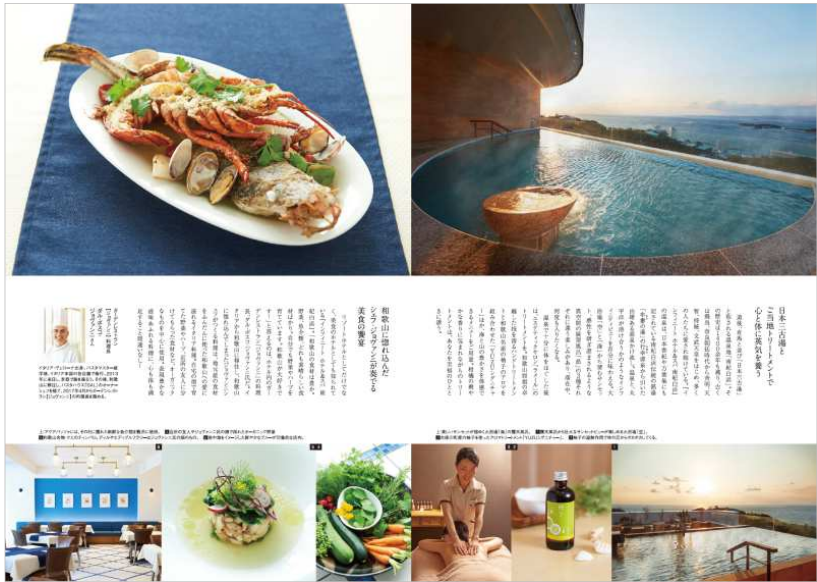
▲ 巻頭記事イメージ ▲