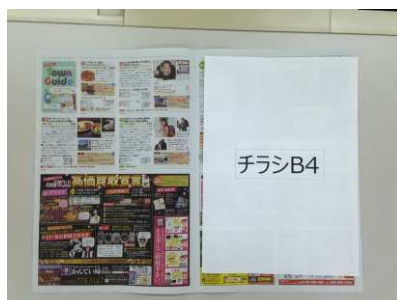
※挟み込みイメージ

ばどんなさんが、手作業でチラシ挟み込み。タブロイドばどの中にそのままチラシを入れ込みます。