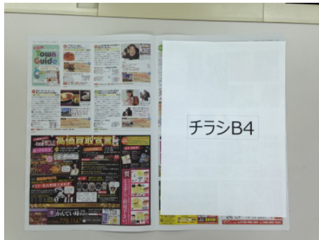
※挟み込みイメージ