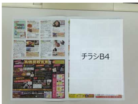
※挟み込みイメージ